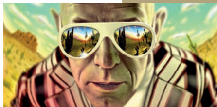
Beb-Deum pour l'Obs

Médiathèque François-Mitterrand, 22h, Forum